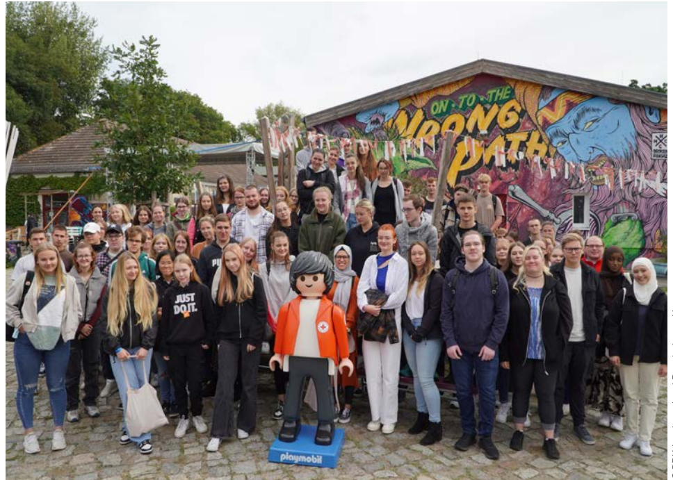
Auf geht's in ein aufregendes Jahr voller wertvoller Erfahrungen und Begegnungen: Auftaktveranstaltung des Freiwilligendienst-Jahrgangs 2022/23 beim DRK-Landesverband Brandenburg e.V.

Um die Finanzierung mussten Träger wie das DRK zuletzt immer wieder bangen: Im Frühjahr 2023 hatte die Bundesregierung angekündigt, die Mittel für die FWD angesichts der angespannten Haushaltslage drastisch zu reduzieren. Träger reagierten empört: Durch die Kürzungen würden zahlreiche FWD-Stellen wegfallen – damit gäbe es weniger Chancen für junge Menschen und eine große Lücke beim Einsatz für das gesellschaftliche Miteinander. Das DRK for-